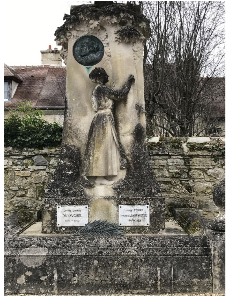
Monument du poète Léon Duvauchel qui se trouve au chevet de l'église. Sculpté par Athanase Fossé élève de l'école nationale des Beaux Arts de Paris.