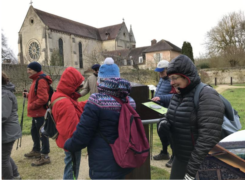
Magnifique hôtel à insectes