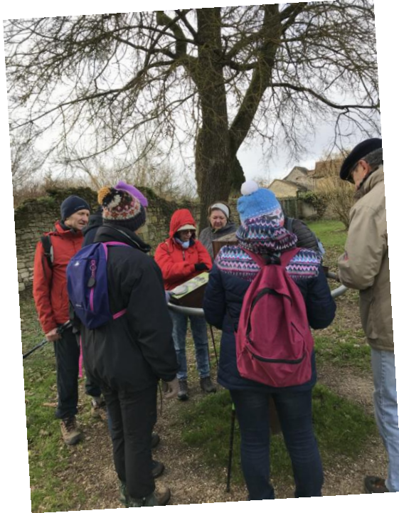
Fin de la balade en passant par le parcours ludique et pédagogique... que des bonnes réponses !!!