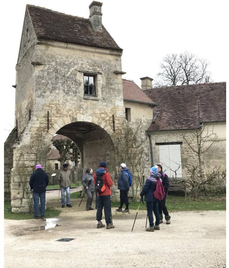
Porche de l'ancienne ferme de l'abbaye aujourd'hui appelée petite cour.